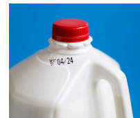
SỮA & TRỨNG