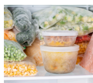
THỰC PHẨM ĐÔNG LẠNH