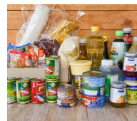
KHÔNG DỄ HƯ HỒNG