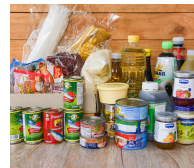
장기 보관 식품