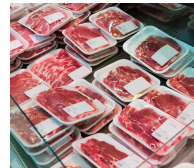
육류 및 해산물