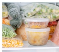
THỰC PHẨM ĐÔNG LẠNH