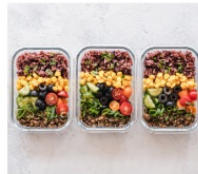
THỰC PHẨM CHẾ BIẾN SẴN