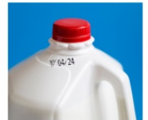
SỮA & TRỨNG