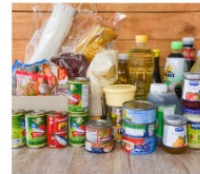
THỰC PHẨM KHÔNG DỄ HƯ HỎNG