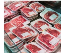
육류 및 해산물