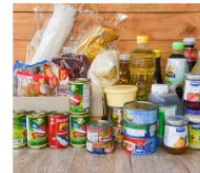
장기 보관 식품